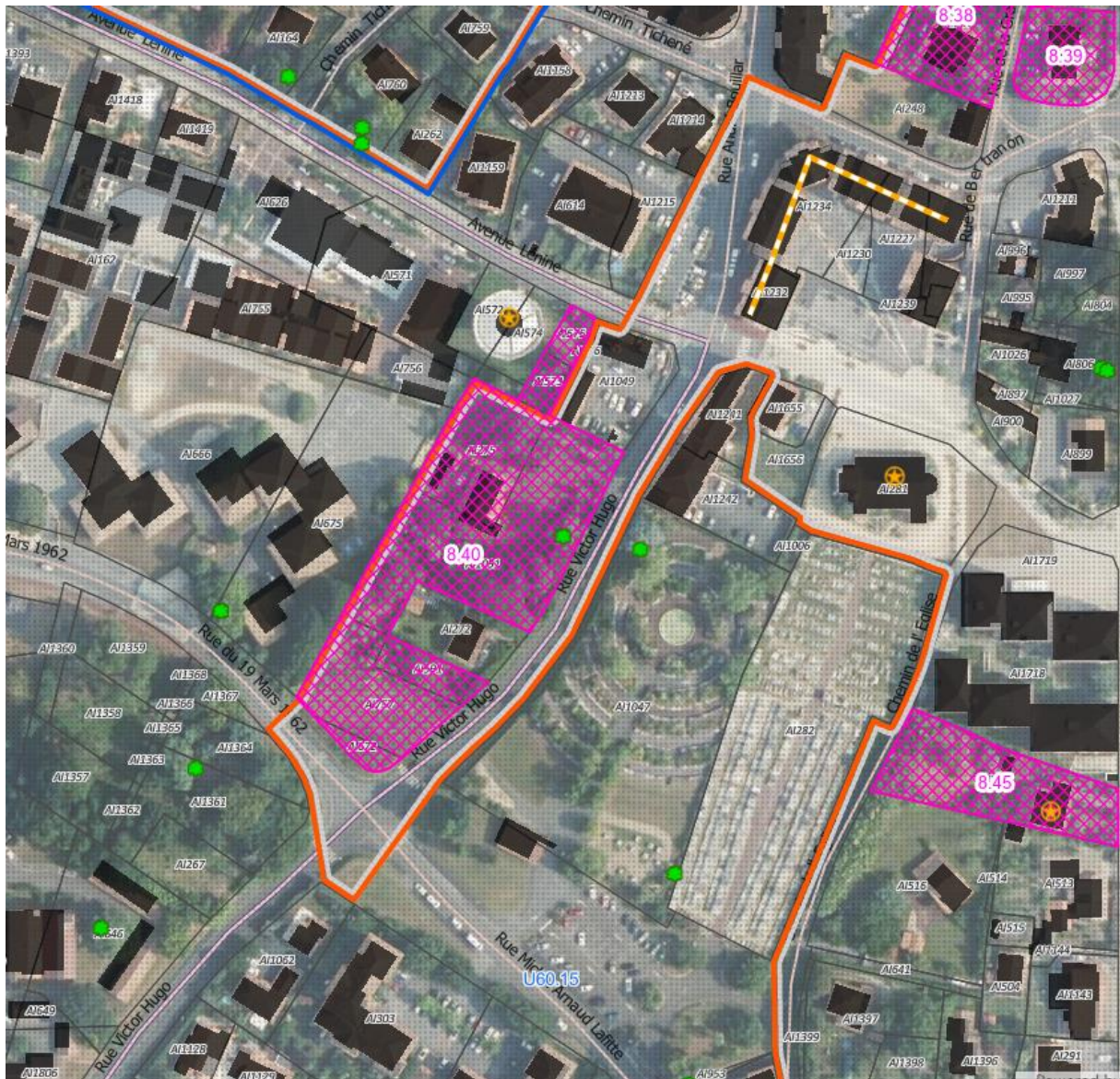
Extrait : PLUi arrêté en date du 5 février 2025